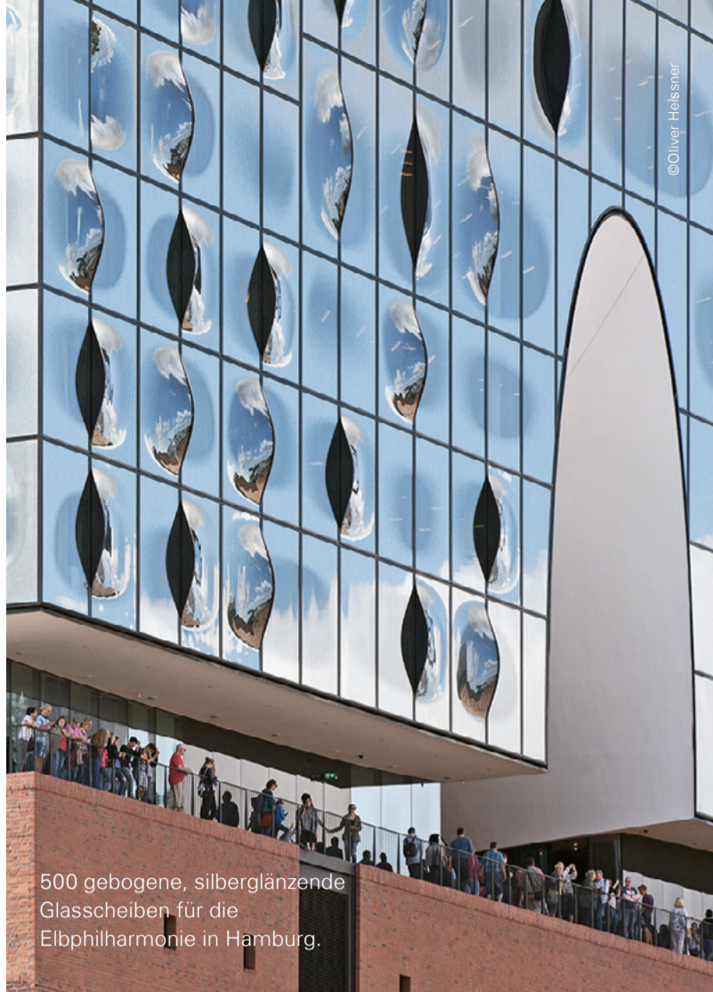
500 gebogene, silberglänzende Glasscheiben für die Elbphilharmonie in Hamburg.

Tag für Tag entstehen bei uns spektakuläre Gläser für spannende Bauprojekte auf der ganzen Welt, für Kunden die jede/r kennt. Dazu gehört eine moderne Manufaktur mit neuesten Maschinen und die Realisierung maßgeschneiderter Lösungen in nahezu jeder Form und Größe für die Architektur von morgen.