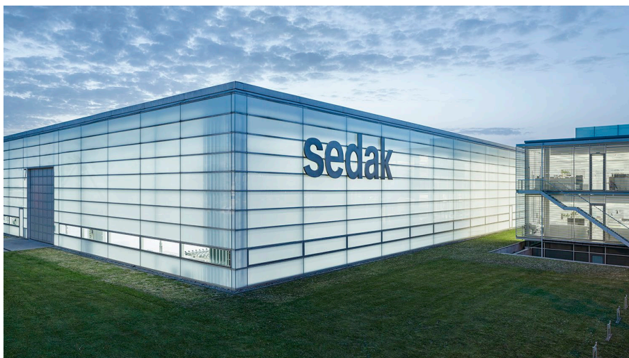
Bild: [24-10_03]: Mit der Investition in die neue Isolierglas-Anlage festigt sedak seine Marktführerschaft.